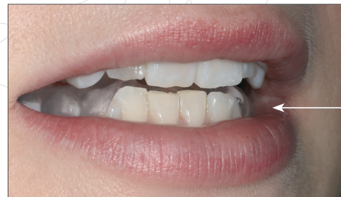
High-Performance Sport Zahnschiene im Mund (beinahe unsichtbar auf den Unterkiefer-Seitenzähnen).

Schritt 3 - Um den optimalen Effekt mit maximaler Performance zu erreichen, werden die SPT-Schienen dem Trainingsfortschritt angepasst und beim Sportzahnarzt nachgeschliffen.